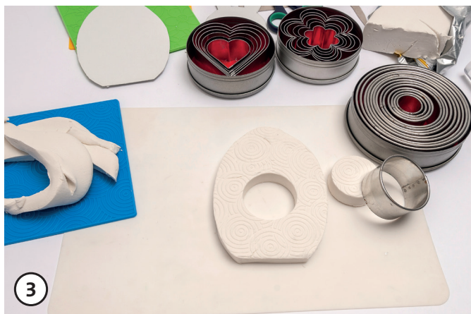
3 Taglia o fustella le forme dei ciondoli scelte.