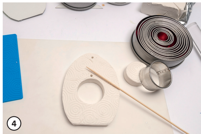
4 Pratica dei fori per nastro e pompon con un bastoncino di legno. Disponi le forme modellate su carta da forno e lascia asciugare all'aria per circa 1 - 2 giorni. Attenzione! Durante l'asciugatura, evita fonti di calore (riscaldamento, sole). Lascia asciugare lentamente a temperatura ambiente per evitare la formazione di crepe.