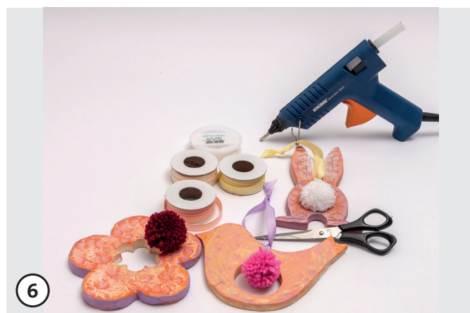
6 Realizza il pompon secondo le istruzioni con il Pomponmaker. Taglia il nastro decorativo alla lunghezza desiderata. Infilala il nastro attraverso un foro ed annodalo. Fissa il pompon infilando il filo nel secondo foro o con un punto di colla a caldo.

Buon divertimento dal tuo team creativo OPITEC!