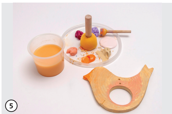
5 Applica il colore con il pennello oppure il set per stampaggi, lascia asciugare.